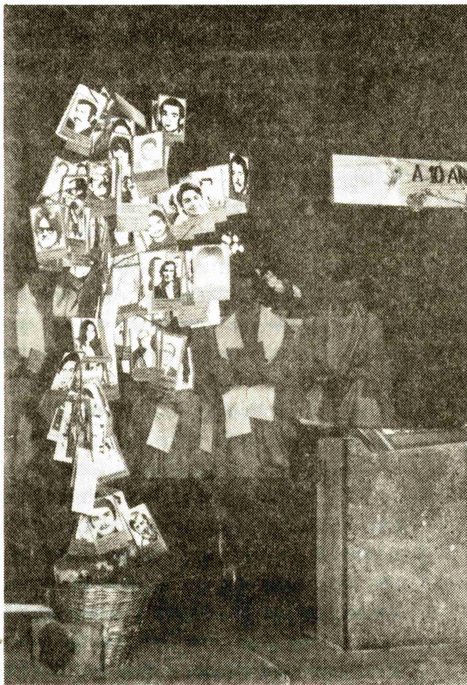
Gesto del árbol de la vida.