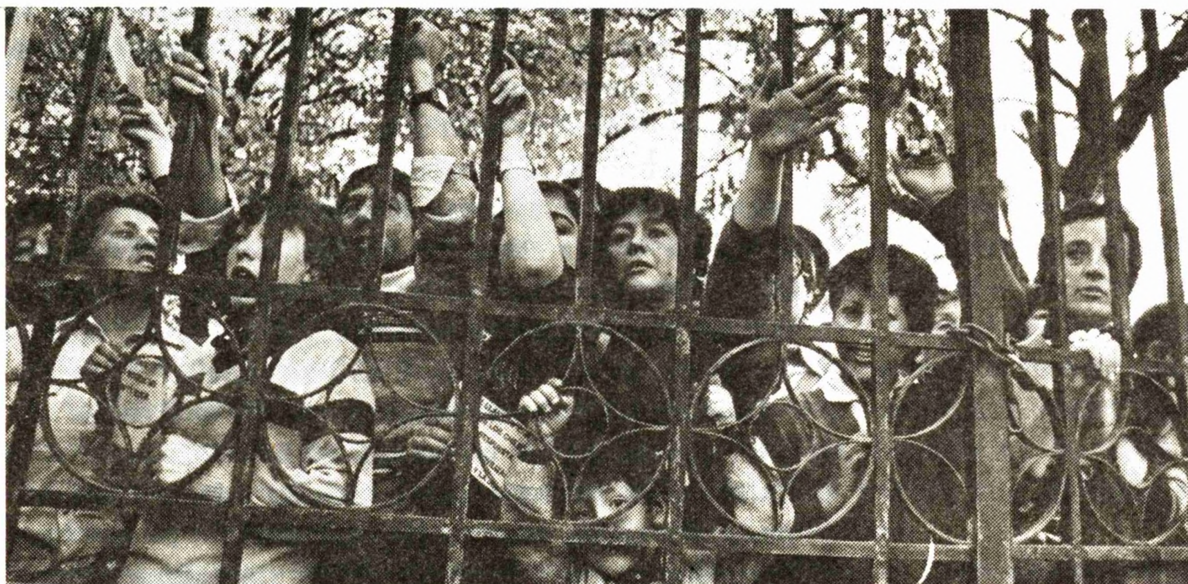
Solidaridad con la Huelga en Santa Filomena.