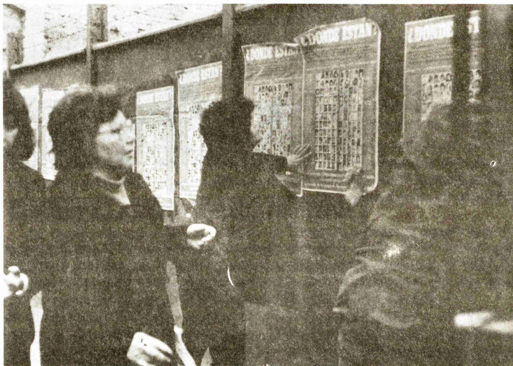
Pegatina de afiches por "los 119".