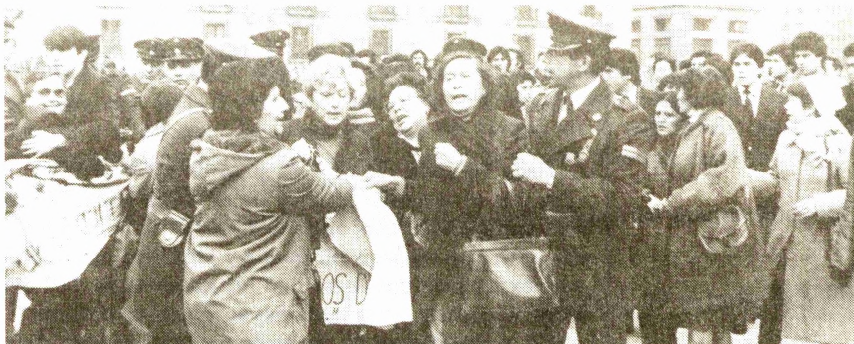
Manifestación frente a La Moneda.