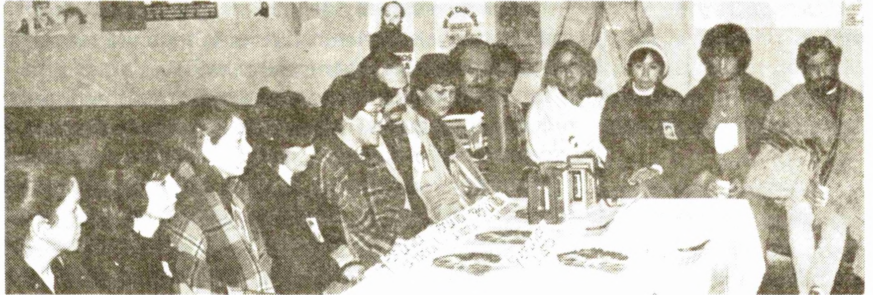
Huelguistas de hambre en la Parroquia Santa Filomena.