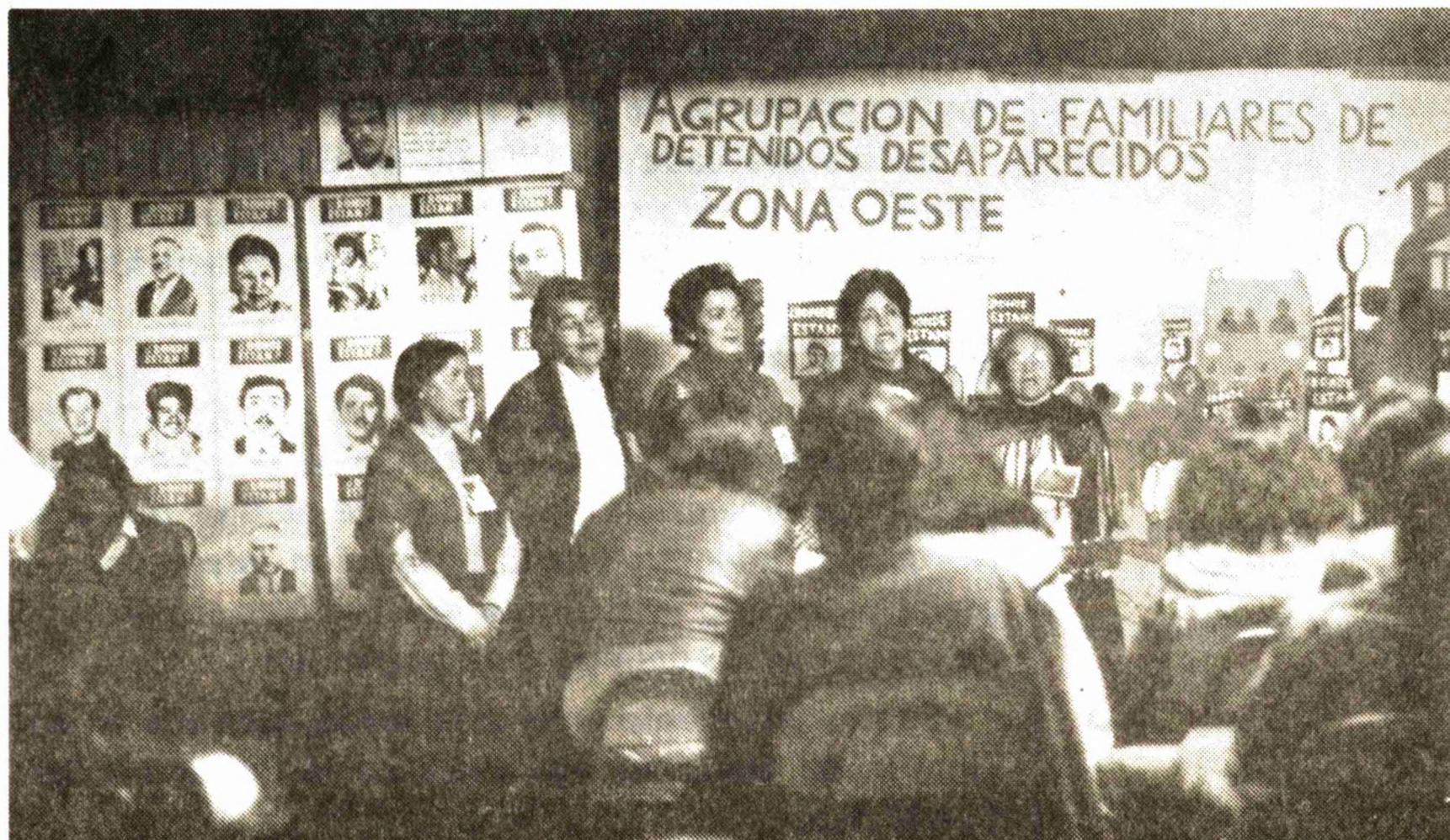
Conjunto folclórico de la Agrupación en acto de la Zona Oeste.