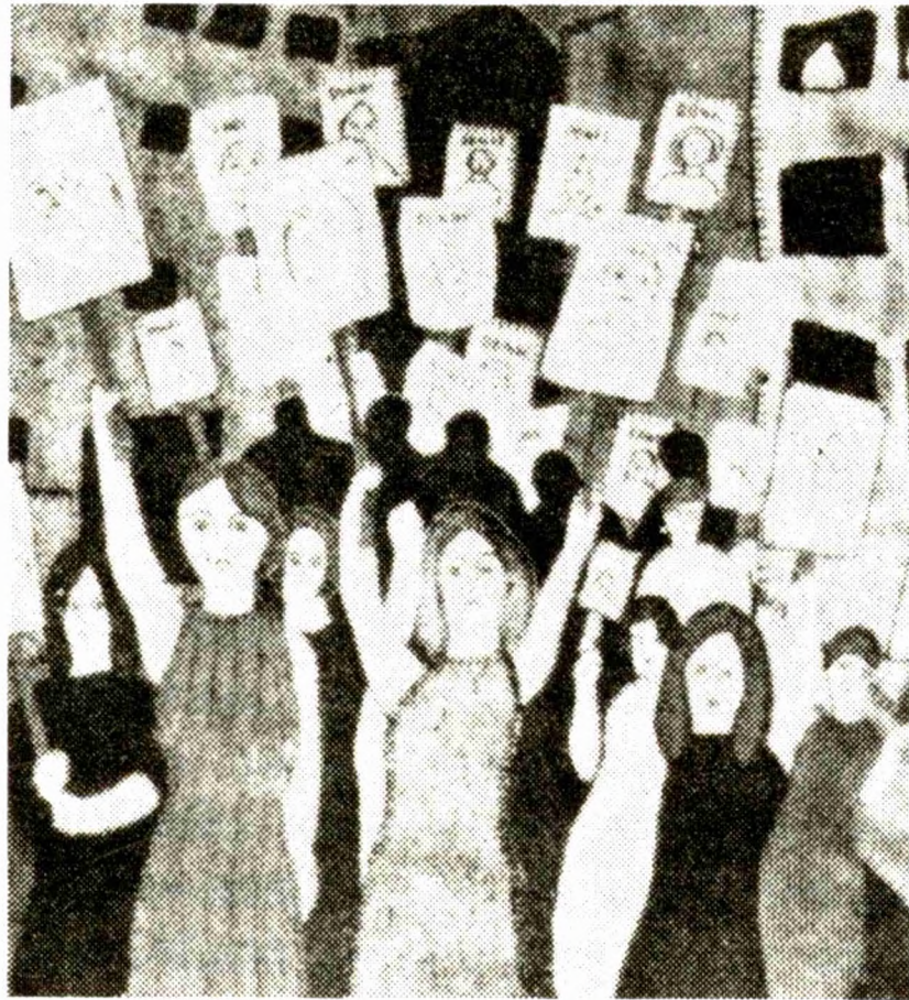
Pegatina de los rostros de detenidos-desaparecidos

"CONSTRUYAMOS UNA AMERICA LATINA SIN DESAPARECIDOS". Se fotocopiaron alrededor de 2.500 rostros de Detenidos-Desaparecidos con la leyenda "DONDE ESTAN" y se editó una cartilla de denuncia del problema titulada "LUCHANDO UNIDOS ENCONTRAREMOS LA VERDAD". Se repartieron invitaciones para el acto solemne y para el Acto Litúrgico dándose a conocer la conmemoración de la Semana y las diferentes actividades a los medios de comunicación.