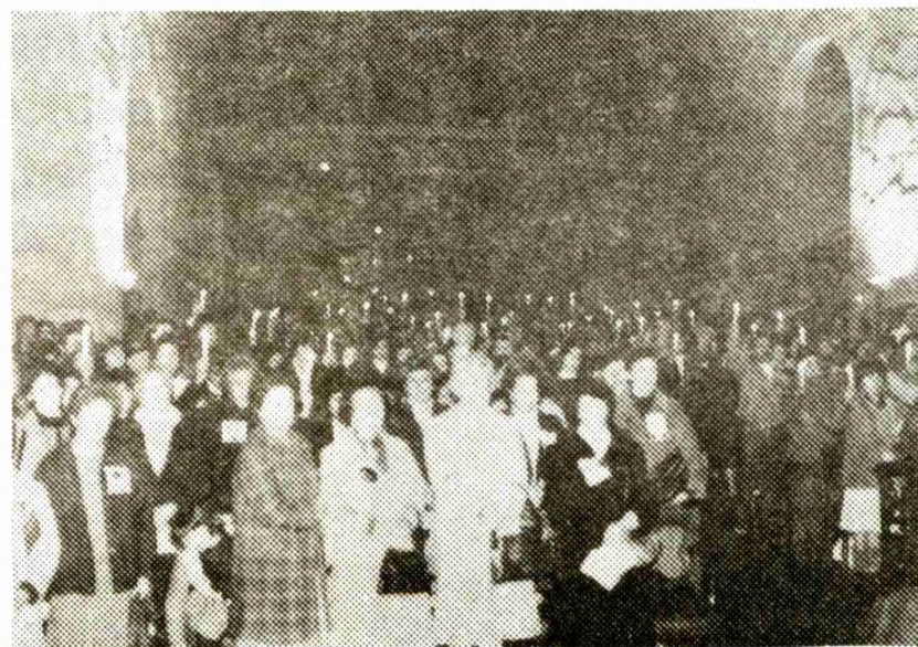
Acto litúrgico Iglesia San Francisco.

Cerca de 700 personas asistieron el día viernes 7 a las 18 horas, a la parroquia San Francisco a la liturgia en conmemoración de la Semana Internacional. Esta tuvo un carácter diferente a lo que estábamos acostumbrados, nos permitió la participación activa y directa de alrededor de 250 familiares de detenidos-desaparecidos, quienes permanecieron duran-